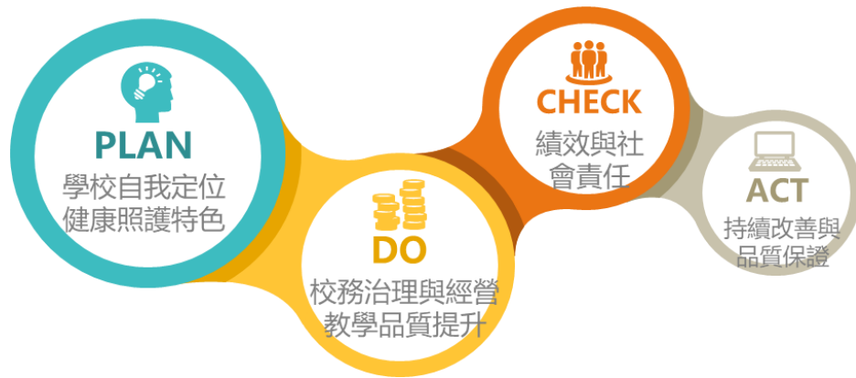
圖 5—校務發展計畫之管理模式