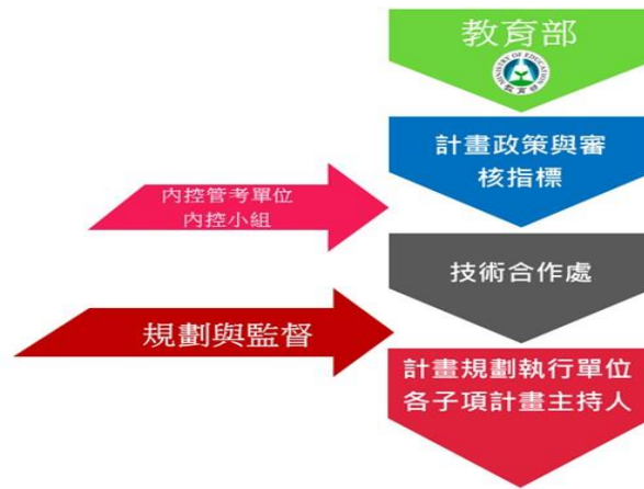
圖 4—計畫組織架構與執行組織分工與運作圖

校務發展計畫之子項計畫執行與推動端賴與全校性、跨單位與多層次之整合與運作，本校為有效確認辦學特色之達成，將管控機制分為「規劃執行單位」、「推動監督單位」與「內控管考單位」三層級組織而成。校務發展計畫之子項計畫工作規劃與執行由「規劃執行單位」負責；而以技合處與各子計畫主持人為「推動監督單位」，另校級單位由技術合作處配合內控小組專責執行進度、經費及成果績效之管控，針對整體執行目標與效益定期進行全面性督導與評估。計畫組織架構與執行組織分工與運作如下：