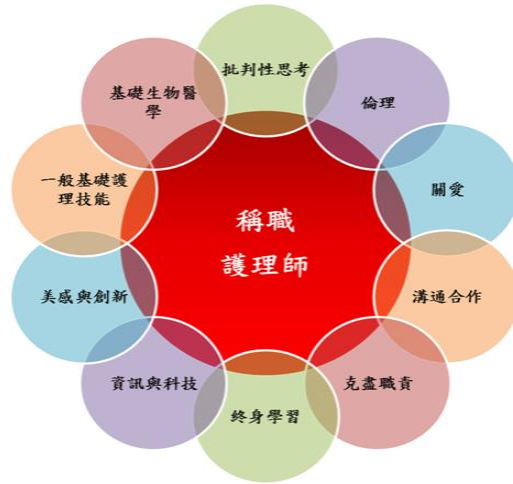
圖一 護理科課程設計